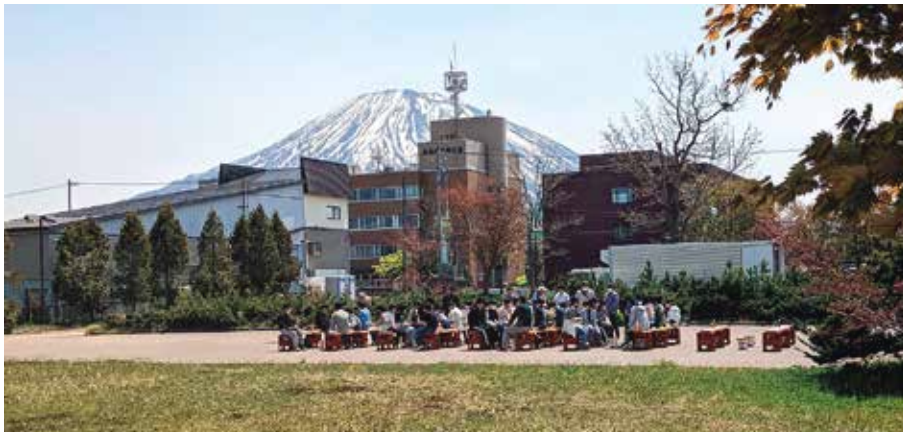
羊蹄山をバックに4施設子供達のBBQ大会 (個人情報保護の観点から遠景による撮影)

Rotary 主催: 倶知安ロータリークラブ 問合せ先: 倶知安ロータリークラブ 協力: 倶知安商工会議所青年部 倶知安商工会議所、倶知安青年会議所、倶知安ライオンズクラブ 倶知安建設業協会、倶知安観光協会、東急リゾート&ステイ(株) 後援: 後志総合振興局、倶知安町 ※お車でお願いの方は、向かいのようちん館(児童支援施設)の駐車場をご利用ください。(ドライバーの数は絶対におやめください) 収益金は、後志管内児童施設の子どもたちのご招待のほか、各施設関連への寄付に当てられます。