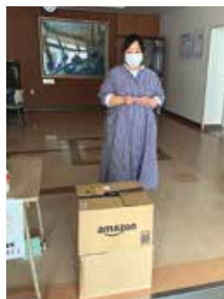
歌棄洗心学園へお菓子のプレゼント