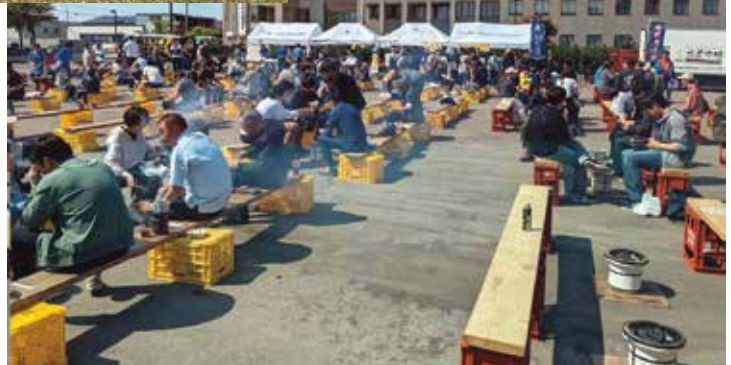
BBQ終了後の子ども達とおのわかれ会