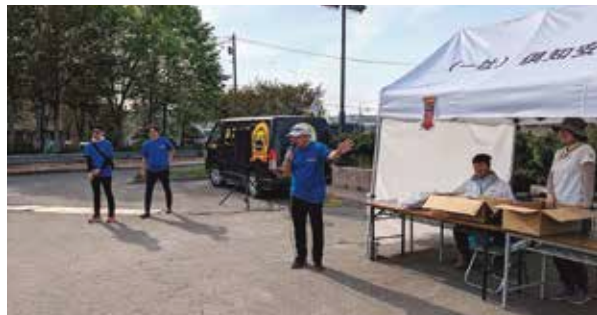
大じゃんけん大会